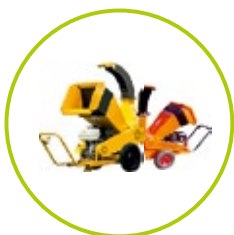
ŠTIEPKOVAČE A DRVIČE