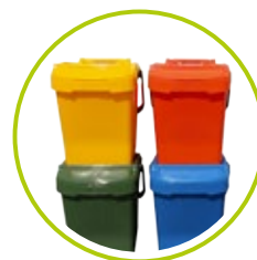
NÁDOBY NA TRIEDENIE ODPADU