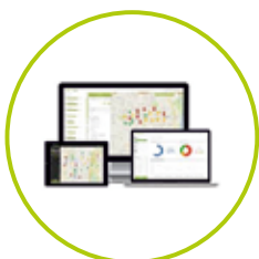
EVIDENČNÉ SYSTÉMY / ELVIS /