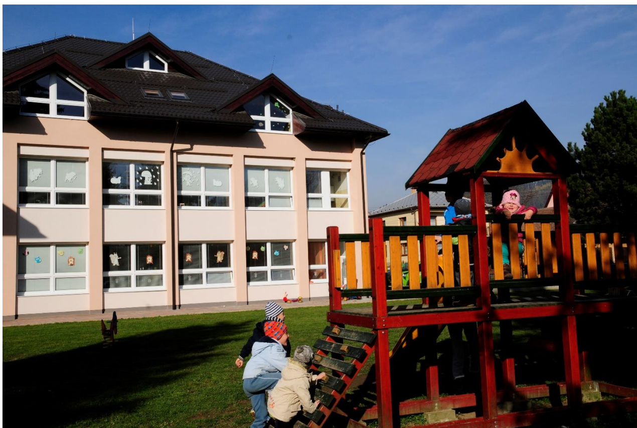
Budova MŠ po rekonštrukcii

Od 1.1. 2015 je prevádzka MŠ v novo zrekonštruovanej a nadstavenej budove. Pribudli nové priestory, v podkroví telocvičňa a stabilná spálňa so sociálnym zariadením.