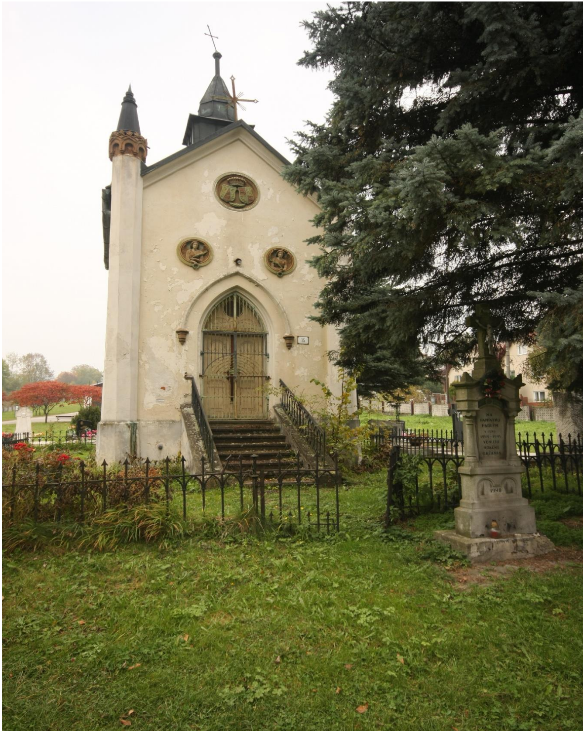
Kaplnka pred rekonštrukciou