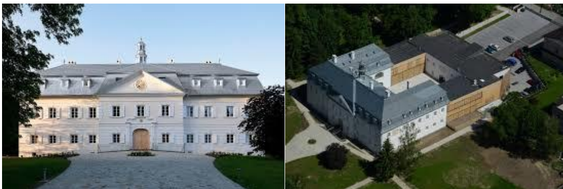
Hotel po rekonštrukcii

V súčasnosti je kaštieľ v Gbeľanoch v súkromnom vlastníctve, kde prebehla veľká rekonštrukcia, výsledkom ktorej je príjemný hotel priamo na ceste do Malej Fatry. Súčasťou hotelu je atraktívne wellness zázemie a reštauračné priestory určené pre zážitkovú gastronómiu. Areál kaštieľa i hotel samotný sú ako stvorené pre svadobné obrady a hostiny či firemné podujatia. V roku 2015 bola dokončená rekonštrukcia hotelu, ktorý slúži verejnosti.