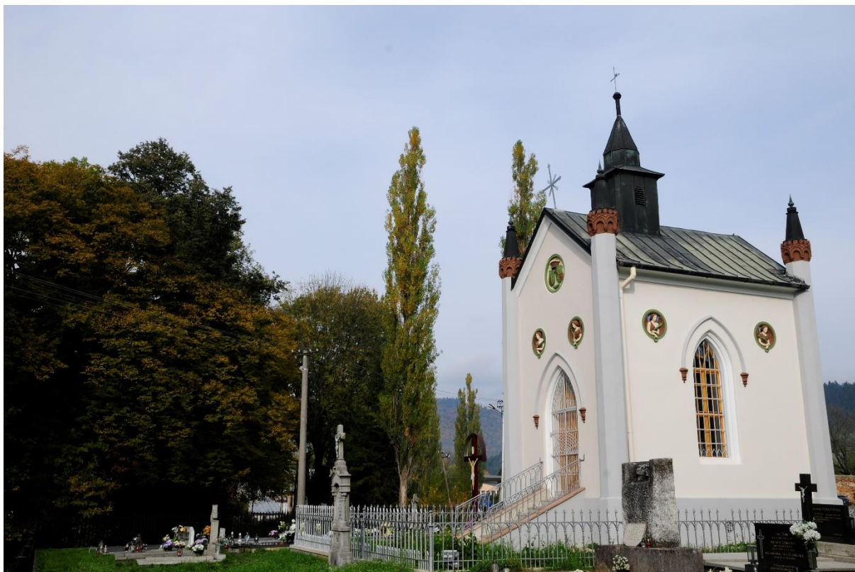
Zrekonštruovaná kaplnka na cintoríne