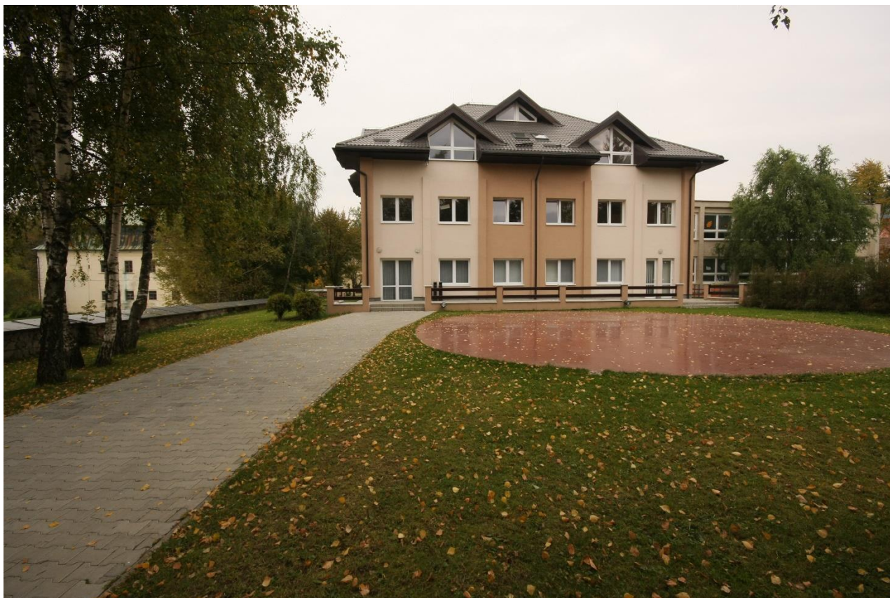
Budova kultúrneho domu po rekonštrukcii

Bolo dobudované Námestie obce pred kostolom, taktiež sa vybudovalo priestranstvo za kostolom, ktoré môže slúžiť ako oddychová zóna.