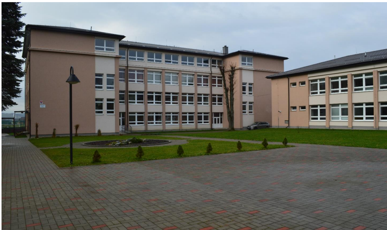
Budova ZŠ po rekonštrukcii