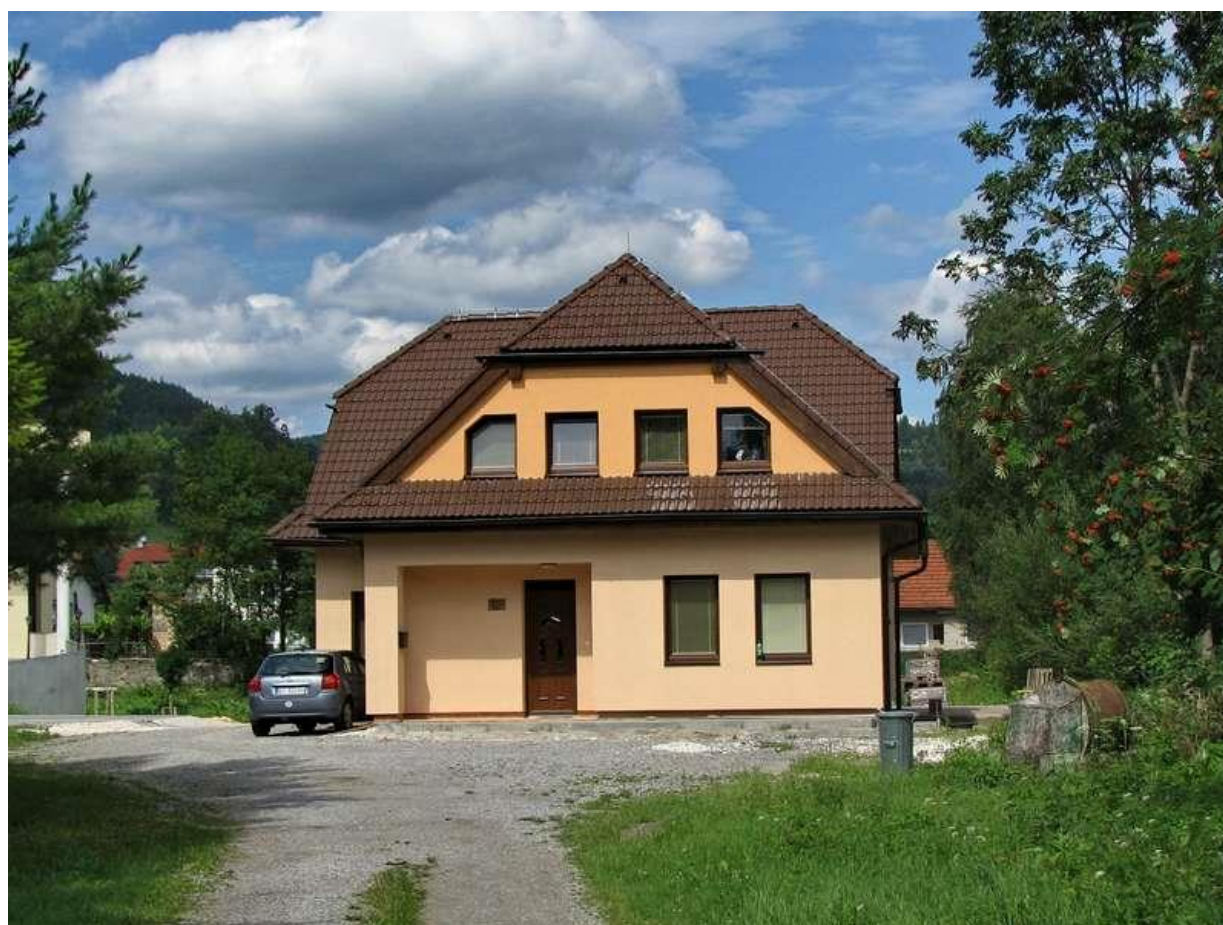
Farský úrad Gbeľany