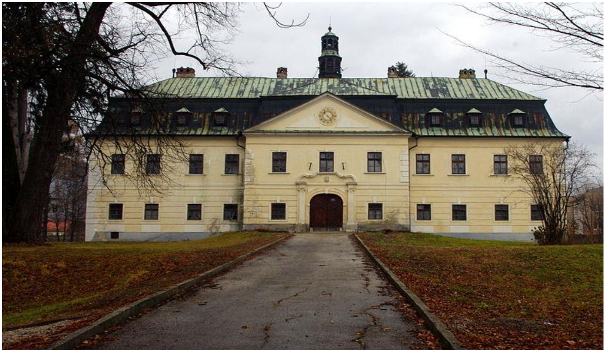
Budova pred rekonštrukciou

Sídlom Gbelianskeho panstva bol honosný barokový kaštieľ z polovice 18. storočia, ktorý stojí uprostred parku, ktorý je obohatený kamenným múrom. Bol sídlom grófskej rodiny, istú dobu tu sídlila škola, neskôr ochranári