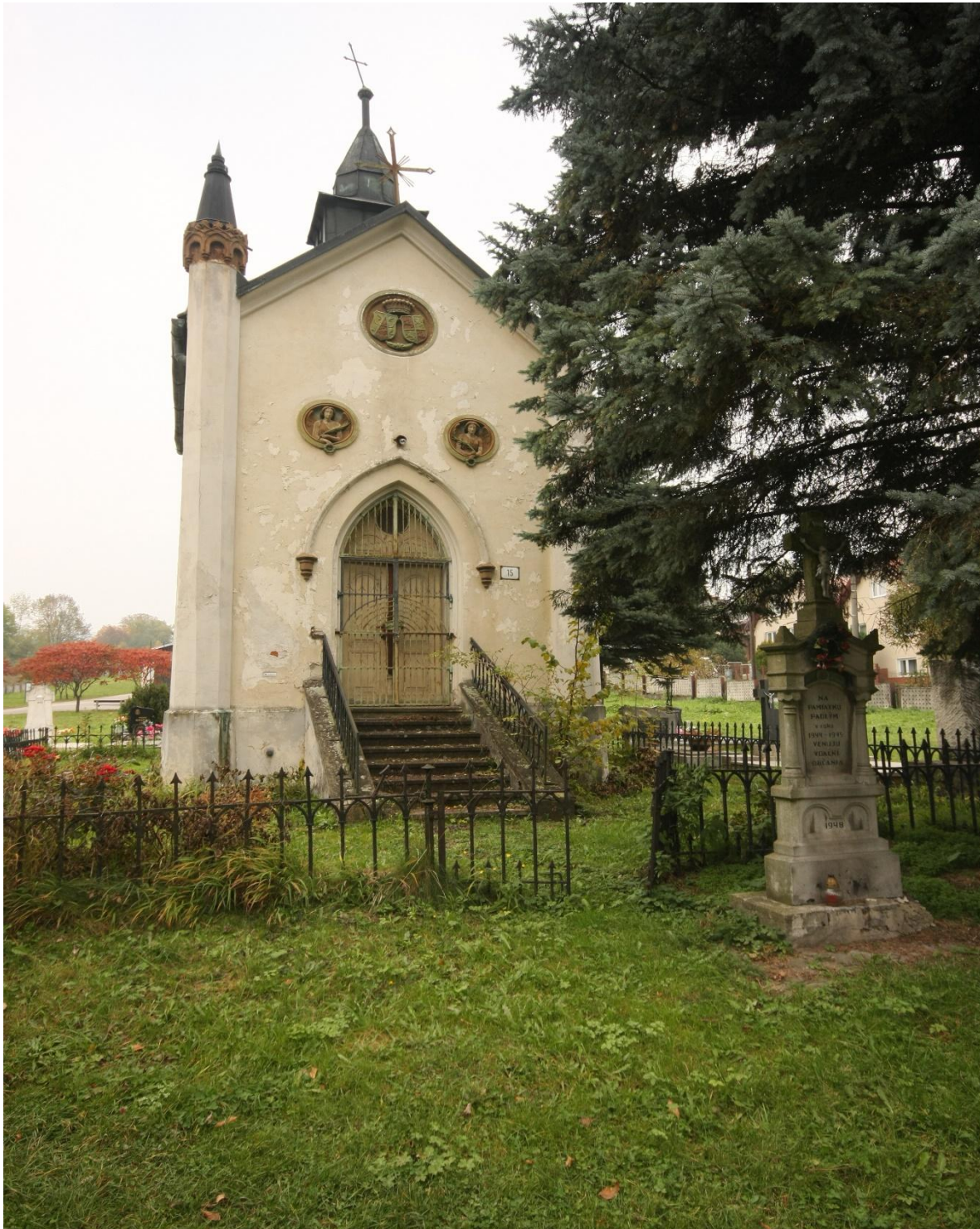
Kaplnka pred rekonštrukciou

výšky a odľahčenie umocňujú aj štíhle a vysoké piliere na rohoch kaplnky. Spojením funkcie hrobky a kaplnky v jednej budove ale aj architektonickým stvárnením sa kaplnka na cintoríne v Gbeľanoch stáva ojedinelou. V širšom okolí mesta Žiliny nenájdeme podobnú kaplnku. Obec sa rozhodla z vlastných financií zrekonštruovať fasádu a schodisko kaplnky. V roku 2015 bola prevedená rekonštrukcia kaplnky – oprava fasády, oplatenie.