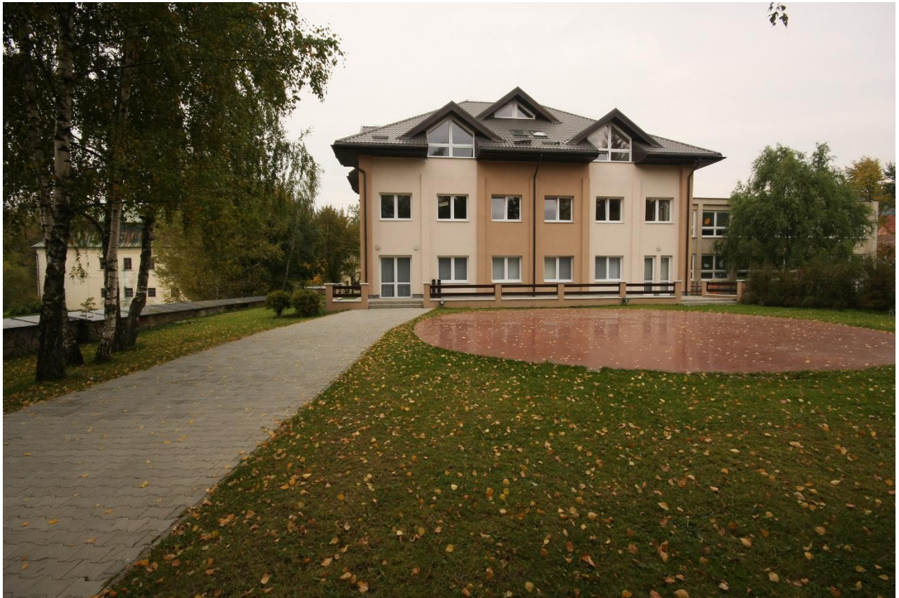
Budova kultúrneho domu po rekonštrukcii

Bolo dobudované Námestie obce pred kostolom, taktiež sa vybudovalo priestranstvo za kostolom, ktoré môže slúžiť ako oddychová zóna.