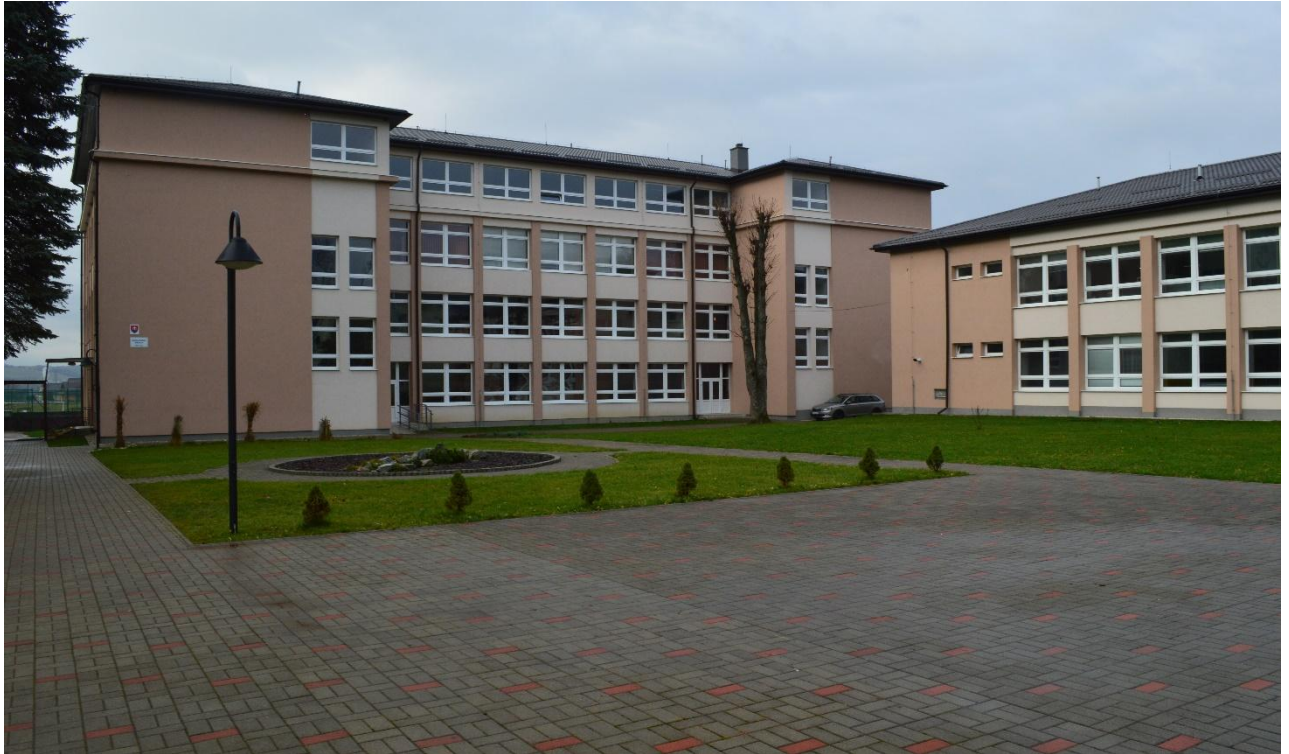
Budova ZŠ po rekonštrukcii